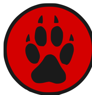
Plakietka Gromady Tropu Wilka